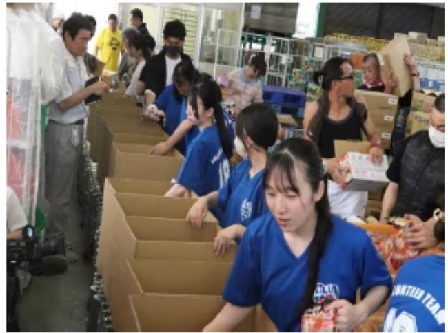
加盟フードバンク団体の活動の様子